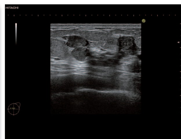
Image haute fréquence de lésions mammaires multiples

Réalisez vos ambitions : un service d'échographie de très haut niveau avec ce qui se fait de mieux en matière de plate-forme d'échographie. Hitachi n'a fait aucun compromis dans la conception et la fabrication du HI VISION Ascendus afin de vous fournir une image haute définition, des fonctionnalités technologiques avancées et une ergonomie optimisée dans une seule et même solution.