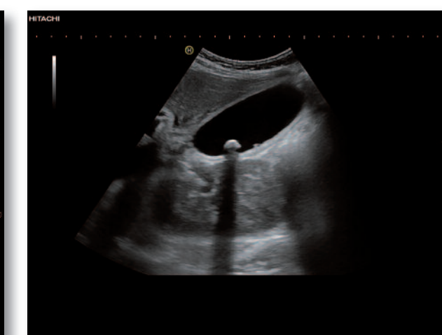
Deux calculs (un de taille millimétrique) dans une vésicule biliaire à paroi épaissie